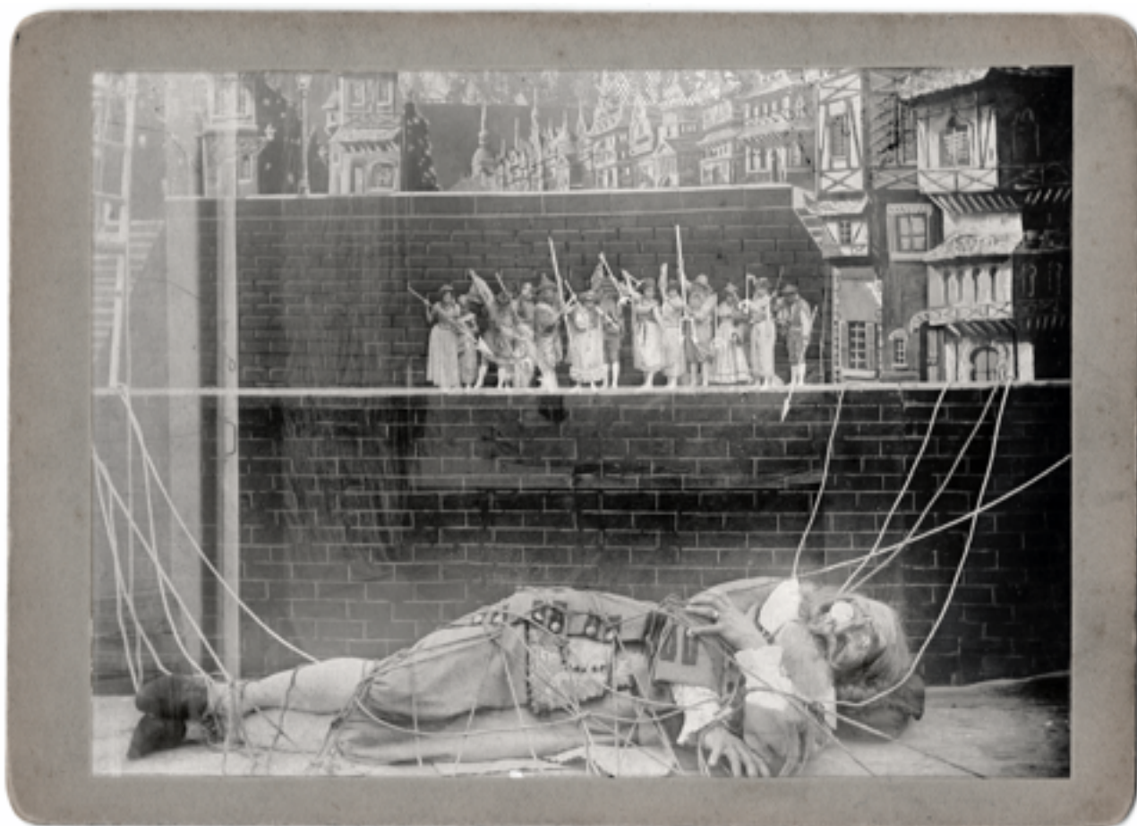
Le Voyage de Gulliver à Lilliput et chez les géants par Georges Méliès (1902).