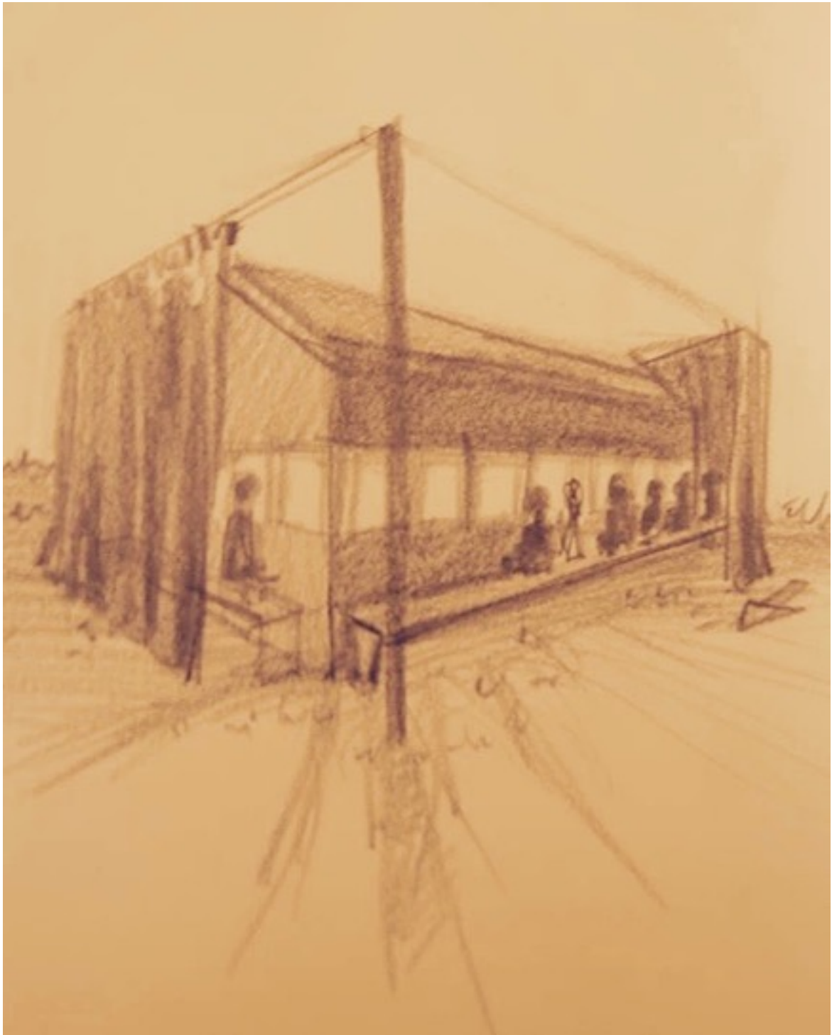
Les « Pièces de chambre » - croquis par Karim Bel Kacem